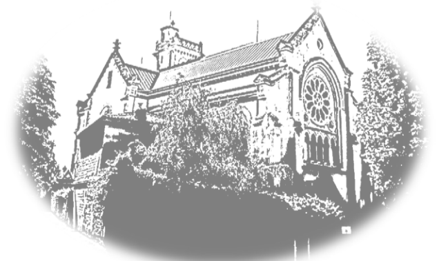
Dal sito della diocesi di Trieste . ridisegnato

con una solenne celebrazione eucaristica sostenuta dal coro degli alpini di Trieste e presieduta da mons. Ettore Malnati suo ultimo Segretario particolare