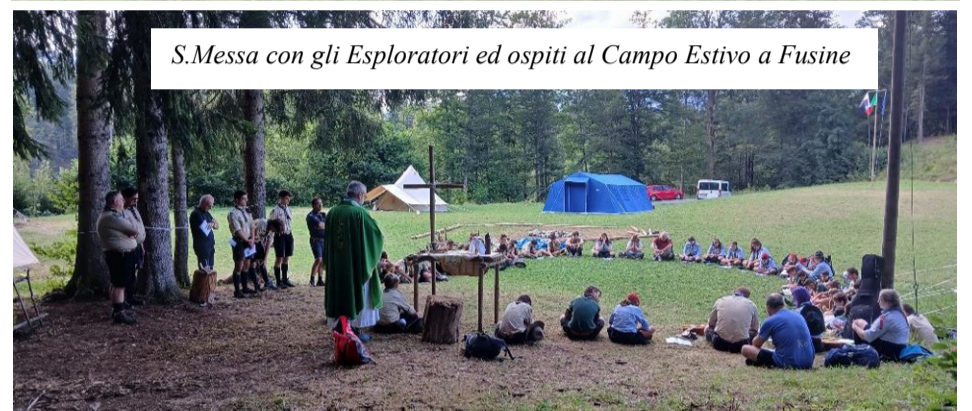
S.Messa con gli Esploratori ed ospiti al Campo Estivo a Fusine