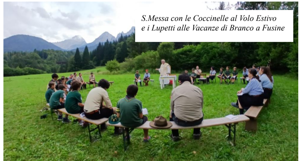
S.Messa con le Coccinelle al Volo Estivo e i Lupetti alle Vacanze di Branco a Fusine